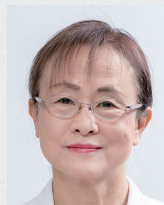
産婦人科部長補佐

います。 なお、当院は東京都の「無痛分娩費用助成事業」の対象医療機関です。都内在住の方は、条件を満たせば無痛分娩にかかる費用の一部が助成される制度をご利用いただけます。詳細は医師にご相談ください。 初めての出産で不安を感じている方も、過去に痛みが強かった経験がある方も、ぜひご相談ください。お一人おひとりの状況に合わせて、最適な方法をご提案いたします。安心して出産の日を迎えられるよう、スタッフ一同、心を込めてサポートいたします。