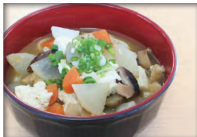
野菜のやさしい旨味たっぷり